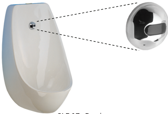
SLP 17 - Domino