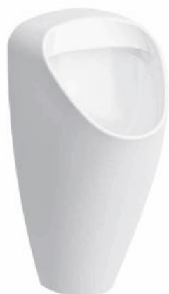
SLP 50 - CAPRINO PLUS RIMLESS