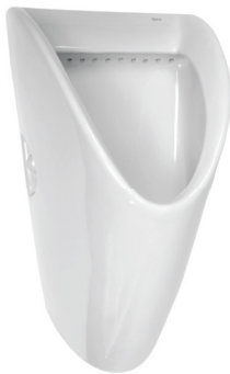
SLP 27 - CHIC